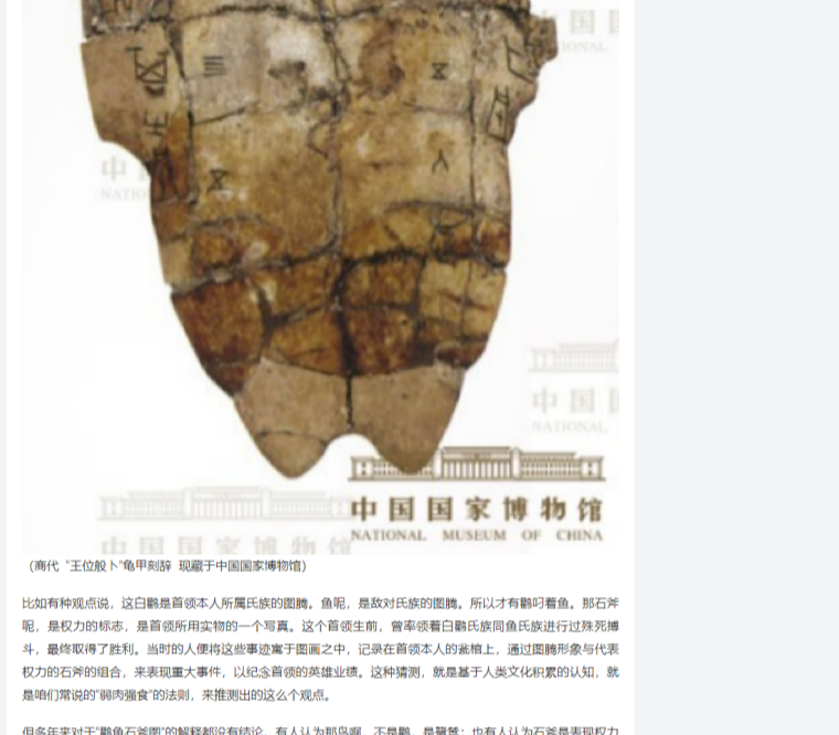
(商代“王位叔卜”龟甲刻辞 现藏于中国国家博物馆)

除了绘画技法上与当时的彩陶截然不同，内容上，主体之间看似是分离的，但其实是有关系的。鸟嘴像鸟啄个鱼，前面有个斧头，这三者之间的关系，凭借我们今天的常识是勾连不起来的。我们知道，鸟和鱼之间的关系比较明确，鸟就是吃鱼的嘴，但这鸟和斧子或者鸟和斧子之间，好像没有什么必然的关系，所以，依我们今天对远古社会的认识，是很难有明确判断的。当时嘛，新石器时代是没有文字的，或者说没有文字保留下来的，我们现在能读到最早的文字就是甲骨文了，那是商代的，但这陶缸的历史比商代还久远呀，所以我们目前所有的观点都是猜测或者是推测编年整理。