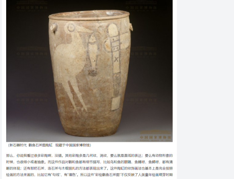
(新石器时代 鸬鱼石斧图陶缸 现藏于中国国家博物馆)

鸬鱼石斧图陶缸为什么会这么神秘呢？ 这上面纹饰主体：左边画了一只鸟，现在多数人认为是鸬鸟，嘴像钩，叫一条鱼；右边画了一把带柄的石斧，纹饰非常清晰，但这件陶缸奇特，高47厘米，体量在彩陶器里也算半个大个儿了，所以它的纹饰画得就特大，在中国已知的彩陶中能画这么大的，画这么大的，仅此一件。