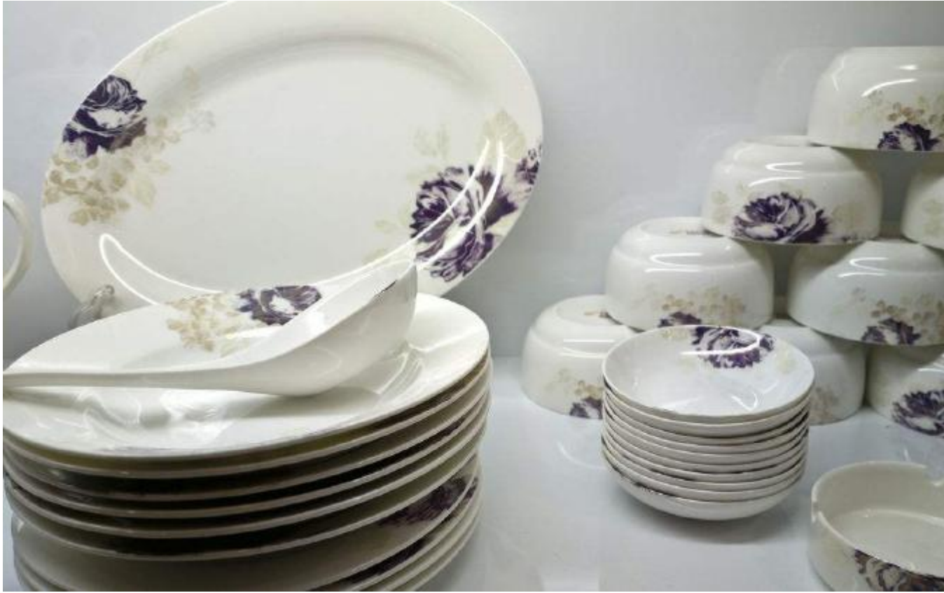
(↑生活中可见的陶瓷制品)